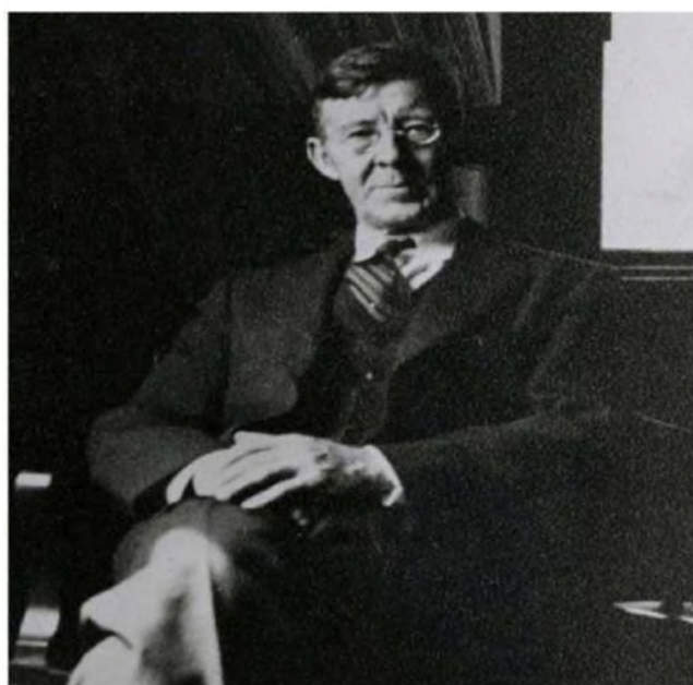
Рисунок 1. П.А. Сорокин

23 сентября 1922 года поездом Москва — Рига отправилась крупная партия «инакомыслящих» в изгнание, в числе которых был и П.А. Сорокин — выдающийся русский философ. Пароходы и поезда, на которых эмигрировала русская интел-