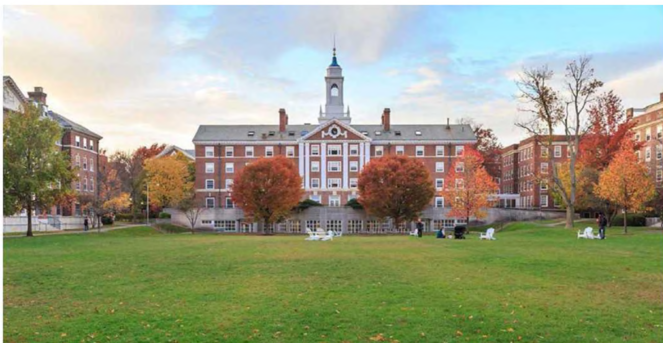
Рисунок 3. Гарвардский университет

казался делить общество на классы, а ввёл такое понятие как «страты» («слои»). В Советском Союзе, где царил пропаганда равенства всех, независимо от статуса, его теория была неприемлема. Всё население делилось на два класса — рабочих и крестьян. Интеллигенция вообще считалась